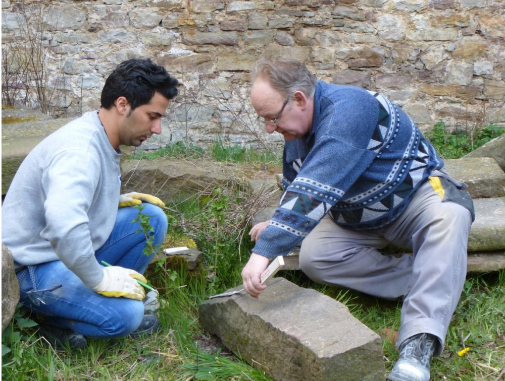
Integrativer Ort BauDENKMAL, Zusammenarbeit im Tandem